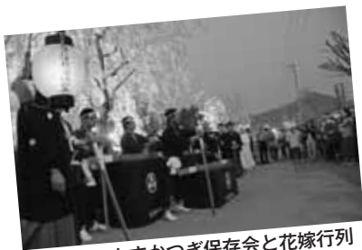
▲貫津たんすかつぎ保存会と花嫁行列イベントには女性会も協力

「天候と桜の開花だけは、思いどおりにならない」。いつも関係者を悩ませる「満開の桜と快晴」その両方がなかった今年。さらにしだれ桜も見ごろと史上最高の「桜まつり」。 今年はお客様がより多く滞在できるよう、人間将棋としだれ桜まつりが同日開催されました。 観光部会では、天童滞在を満喫してもらおうと、「桜まつりパスポート」も発行し、天童を回遊できる仕組みづくりに取り組みました。利用者からの評判もよく、今後も最強の天童桜まつりにするべく関係者とも協働していこうと考えています。