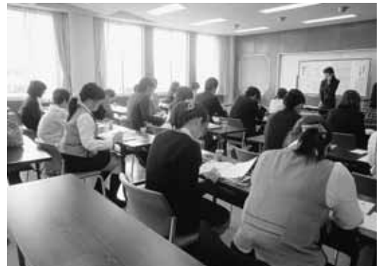
▲第1回目の「電話で伝える～電話対応マナー研修～」は25名が受講しました