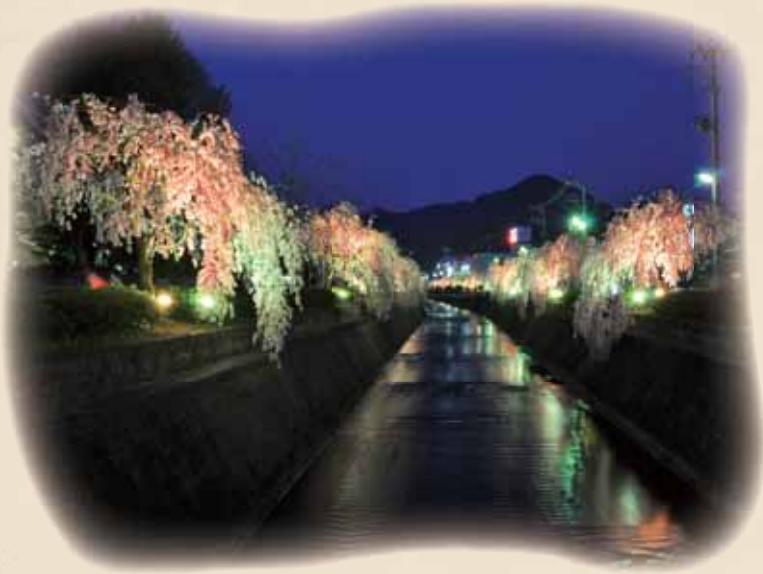
▲ライトアップされた倉津川の“しだれ桜”