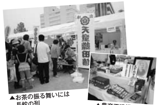
▲お茶の振る舞いには長蛇の列

甲冑武者による天童のパンフレット配布、農商工連携商品販売「楽市楽座」、天童織田藩のお茶振る舞いや、水の提供、織田藩の奨励する将棋駒実演など、織田をテーマに天童をPRしました。メイン広場の県民ふれあい広場に来場した大勢の方に、天童の魅力を発信しました。