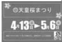
▶桜まつりパスポートには56店舗が協力