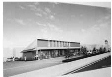
▲ 芳賀支店 (本年10月オープン予定)