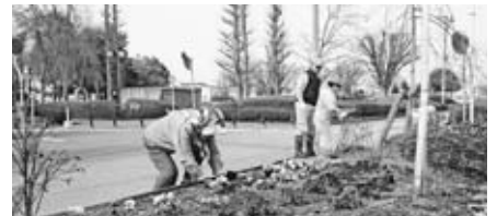
▲町内会にて花を植栽