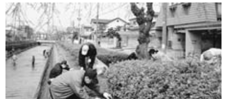
▲植込みは観光部会担当