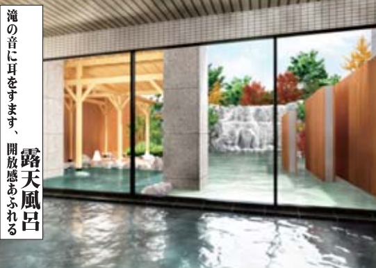
滝の音に耳をすませ、開放感あふれる 露天風呂