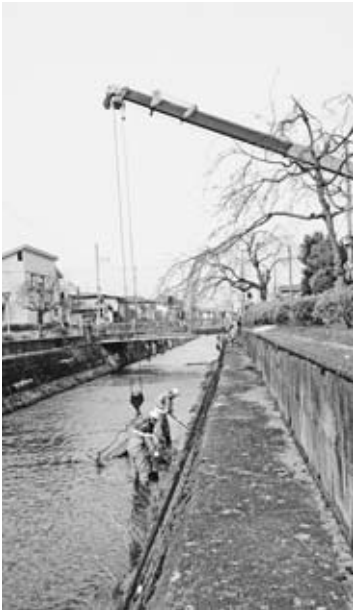
▲クレーンで川の中のゴミを引き上げる