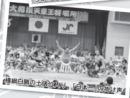
横綱白鵬の土俵位入り、「日本一」の掛け声

大相撲夏巡業「天童王将場所」は、8月15日天童市スポーツセンターで満員御礼の観衆2560名の中、開催しました。日本相撲協会の力士と関係者250名は、前日に天童温泉に一泊。王将場所当日は、開催を待ちわびた多くのファンが、早朝より力士の会場入りに詰めかけをました。午前