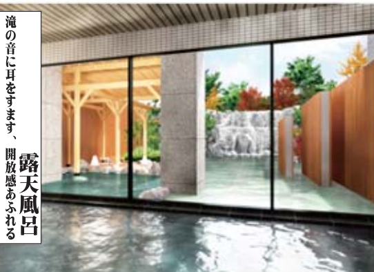
滝の音に耳をすませ、開放感あふれる 露天風呂

軽トラ市in天童2015の本部テントにて新しいてんてんカードを先着200名様に2,500円分のスタンプを押してプレゼントいたします。 日 時：平成27年9月27日(日) 午前10時30分～(先着200名) 場 所：軽トラ市in天童2015(会場内本部テント) ※県道山形天童線・天童駅前交差点から新寒河江街道交差点まで 特 典：2,500円分のスタンプが押された新しいてんてんカードを先行プレゼント 問 合 せ：てんてんカード会事務局(天童商工会議所 TEL 654-3511)