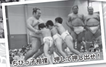
ちびっ子相撲 押して押し出せ!