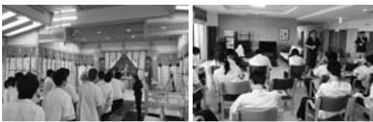
▲サービス・福祉コース