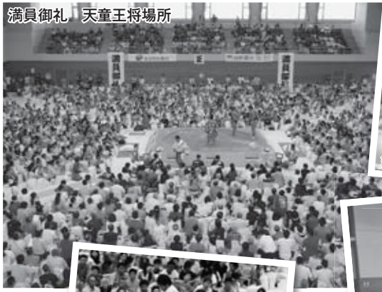
満員御礼 天童王将場所