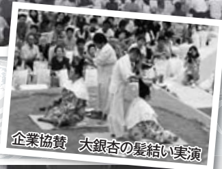
企業協賛 大銀杏の髪結い実演