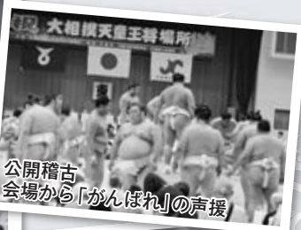
公開稽古 会場から「がんばれ」の声援