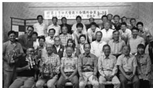
▲懇親会にて「ハイチーズ」