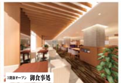
3階新オープン 御食事処