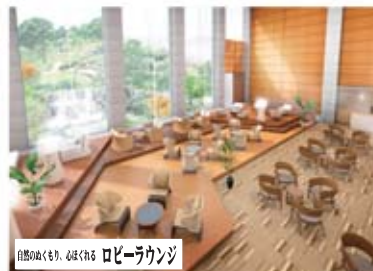
自然のぬくもり、心ほぐれる ロビーラウンジ