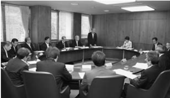
▲吉村知事と懇談する商工会議所会頭