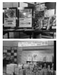
▲豪華賞品の数々 ご協賛ありがとうございました。