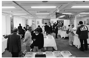
▲熱心に見入る来場者