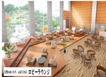
自然のぬくもり、心ほぐれる ロビーラウンジ