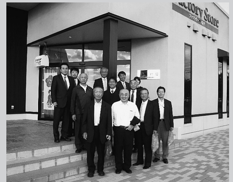
▲前列左から松村工業副会長、吉野木村屋社長、大石工業部会長

10月26日(月)、鶴岡市で整備・運営している先端技術研究産業支援センター(レンタルラボ)と古鏡で有名な(有)木村屋の視察研修を行いました。