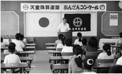
▲天童より5名全国入賞

全国各地で6月～7月に「2015年全国あんざんコンクール」(日本珠算連盟主催・日本商工会議所後援)が開催され、全国で16552名が参加しました。小学校1年生以下から一般の部Ⅱまで12部門に分かれ、天童地区より5名の方が全国入賞(100位以内)しました。