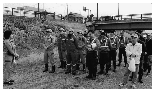
▲毎年、芋煮会シーズンが終わった河川敷の清掃活動を行っています