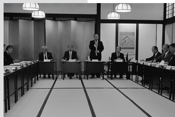
▲天童市地域振興懇談会

その後の意見交換は、商工会議所が地域経済及び地域振興に果たす役割の大きさを理解していただく、絶好の機会となりました。 天童商工会議所は、地域総合経済団体として会員の声を集約し、意見要望活動を展開してまいります。「ひと・まち・企業、躍進つづける天童」の実現に向け、会員の皆様の「声」を、引き続き きお聞かせ ください。