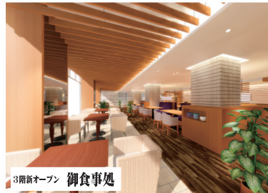
3階新オープン 御食事処