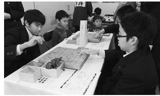
▲来場者同士の対局