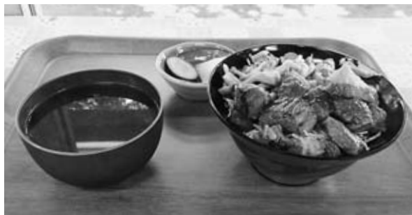
▲金曜日の特別メニュー「ステーキ丼」