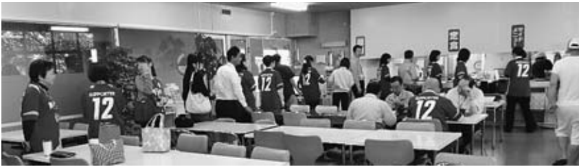
▲ステーキ丼には長蛇の列