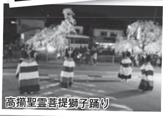
高嶺聖霊菩提獅子踊り