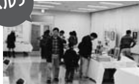
パルテでは、「天童将棋駒まつり」が開催され多くの観光客が実演などを楽しみました。