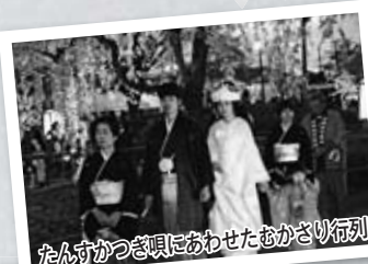
たんすかつぎ唄にあわせたむかさり行列