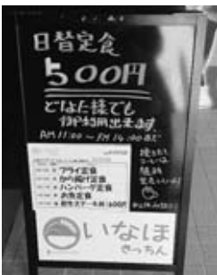
▲市役所正面の看板