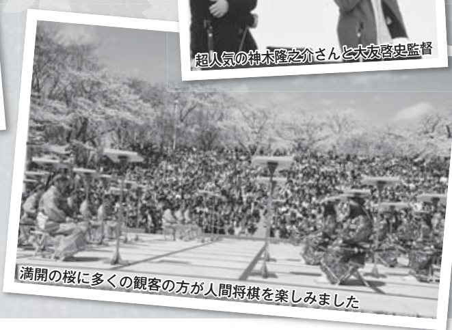
満開の桜に多くの観客の方が人間将棋を楽しみました