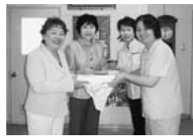
▲女性会は社会福祉活動にも力を注いでいます

これらの事業は継続していく難しさを感じるも「続ける大切さ」を第一に、今後も取り組んでまいります。私の事業所は、市の南端にあり中心部から離れています。中心部の空洞化や郊外への進出等が進む一方、市全体が連携を取り合い各地で盛り上げれば相乗効果で市全域の活性化につながるのではないかと思います。