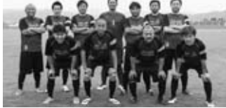
▲商工会議所青年部 全国サッカー大会 長井大会