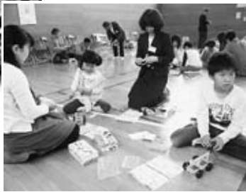
ゴム動力カーを制作している様子▶