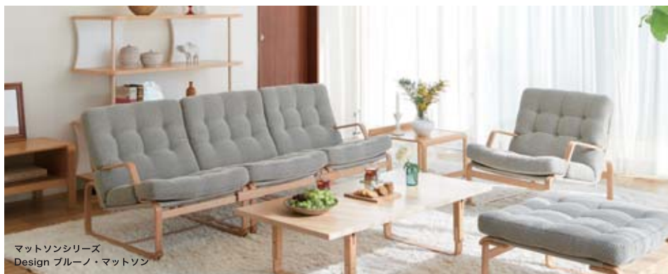
マットソンシリーズ Design フルーノ・マットソン