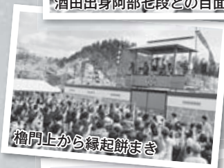
檜門上から縁起餅まき