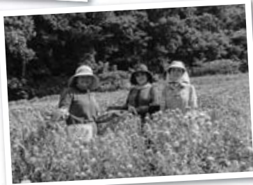
紅花摘みを▶ 行いました