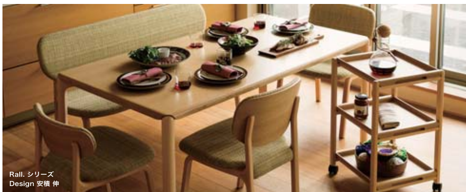
Rall. シリーズ Design 安積 伸