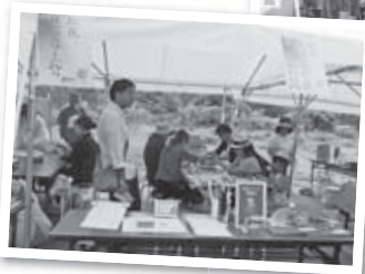
◀紅花リップ作り体験