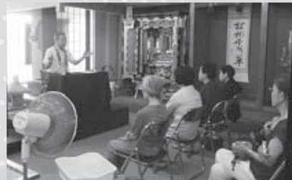
◀世界の宗教について(仏壇のすところ)