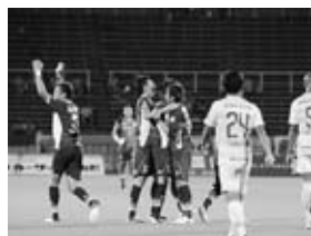
▲ゴールを決めて抱き合うモンテディオ山形の選手

順位は前節より1つ上がり14位ですが、上位との勝ち点を大きく縮めました。天童市民応援デーに7,529人の観客が来場し、勝利の瞬間は歓喜で会場が沸きました。