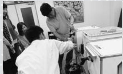
▶生ヒールの美味しい注ぎ方(大黒屋)