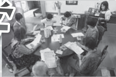
◀IHでこめ油の美味しい使い方(三和油脂と東住宅のコラボ講座)

天童まちなか大学は、前期講義を開催しました。新たな取り組みとして、商店同士がお互いの強みを生かした「コラボ講座」や「商工マイスター」制度などの要素を追加しました。多くの講座で定員数を上回る受講希望者が集まり、追加講座開催の要望が多く寄せられました。講座を開催した商店からは、「講座を担当した社員が、積極的に商品知識を勉強するようになった。店を知ってもらっただけでなく、従業員を育てる効果もあるので、今後も継続して参加していきたい」との声もありました。後期講義の募集は、8月より行います。詳しくは今月号折込チラシをご覧ください。