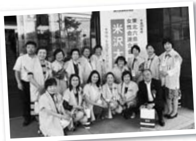
◀天童女性会からは 17人で参加