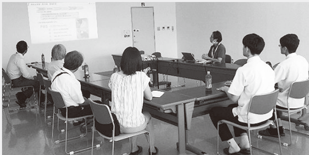
食品製造過程について説明＝㈱ニチレイフーズ

参加した高校生からは、「就職を考えるうえでとても参考になりました」という声が聞かれ、先生方からは「複数の企業を1日で訪問できる貴重な機会となりました。学校に戻り生徒達へ訪問企業の話をつードバックします」という声をいただき有意義なツアーとなりました。