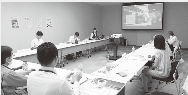
企業説明の様子＝日新製薬㈱