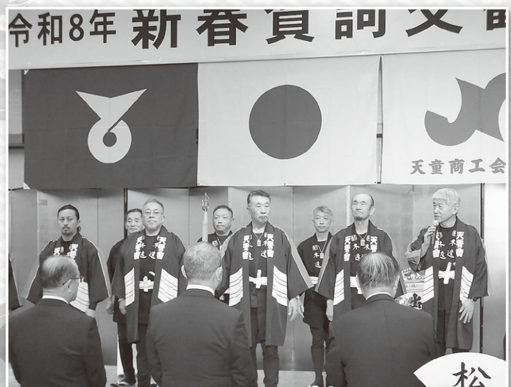
▼天童木遣り天聲會による木遣り

天童市と天童商工会議所の主催による「令和8年新春賀詞交歓会」が、1月5日、ほほえみの宿滝の湯において開催されました。会場には、市内外から行政、経済、各種団体の関係者など約333名が参集し、新年の門出を祝うとともに、交流を深めました。 当日は、天童木遣り天聲會による歓迎で華やかに開幕。主催者あいさつ、新年のあいさつに続き、鏡開き、乾杯と進行し、和やかな雰囲気の中で新年の抱負や地域の将来について語り合う場となりました。 また、万歳三唱で締めくくられた会後は、参加者一人ひとりが地域の発展と連携の大切さを改めて確認する機会となりました。今後も官民一体となった取り組みを通じ、活力ある地域づくりを進めてまいります。