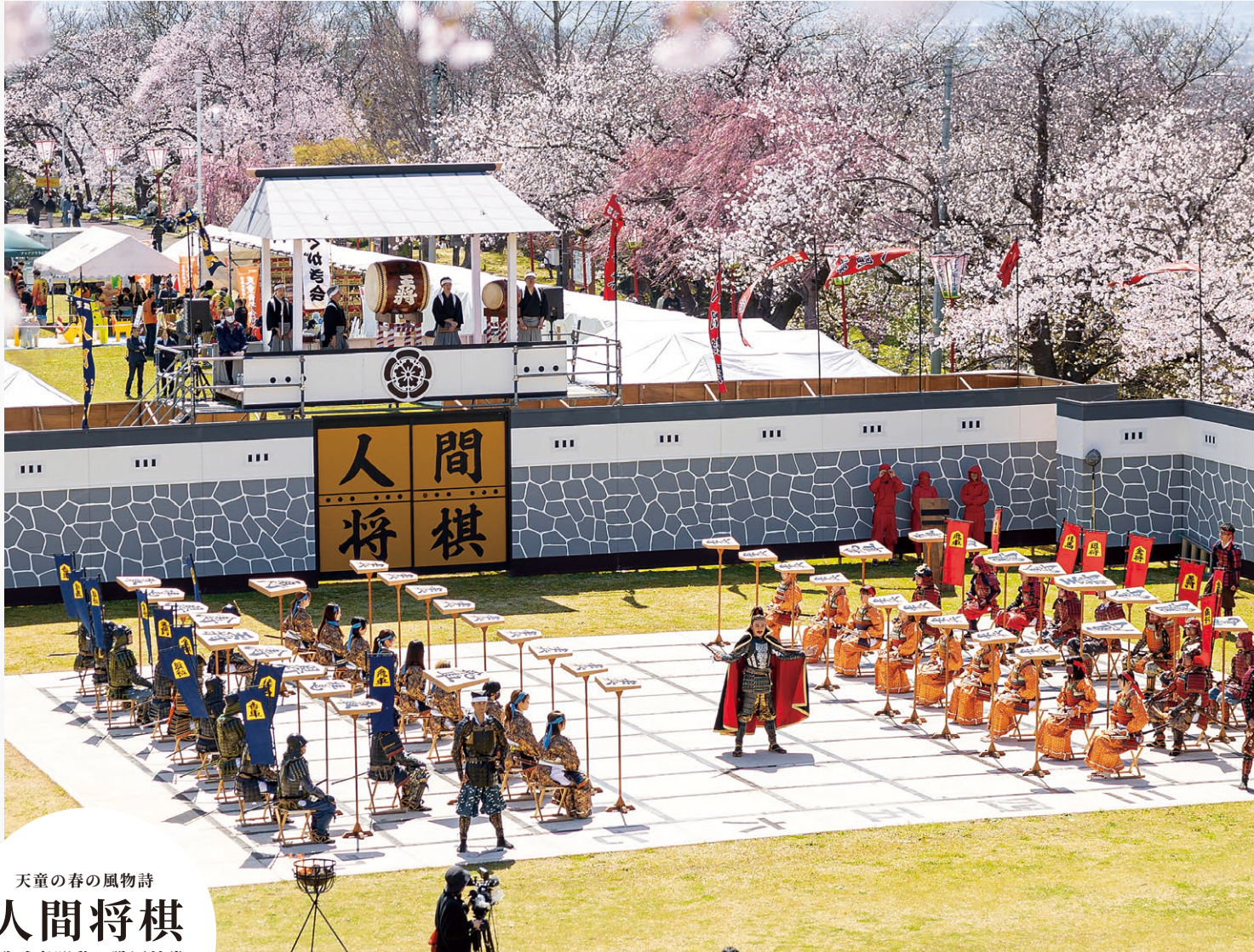
天童の春の風物詩 人間将棋 駒武者躍動の戦国絵巻 (天童市・舞鶴山)

桜満開の舞鶴山で4月11、12日の両日、人間将棋が行われ、2日間で約10万人の観光客で賑わいを見せました。会場では桜吹雪が舞うなか、プロ棋士同士の熱戦が繰り広げられ、駒に扮した腰元や武者が縦横無尽に盤上を躍動しました。