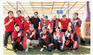
女性会・青年部がブースを出店