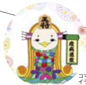
コマノアマビエ イラストレーターYUKI