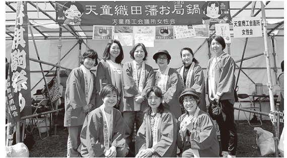
人間将棋に「女性会」も出店