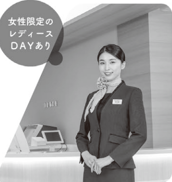
女性限定の レディース DAYあり