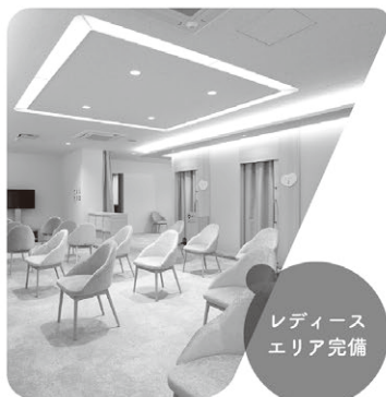
レディース エリア完備

山形労働局労働基準部賃金室 (TEL 023-624-8224) 又は最寄りの労働基準監督署