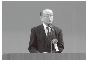
祝辞を述べる新関市長