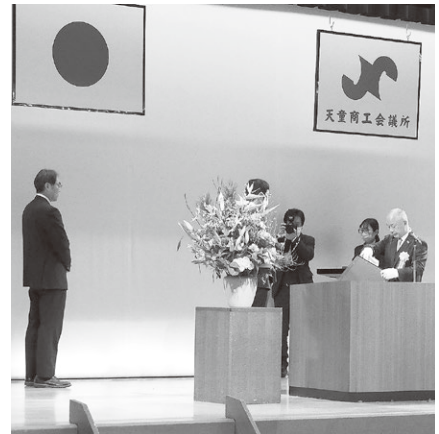
野川会頭より表彰状の授与