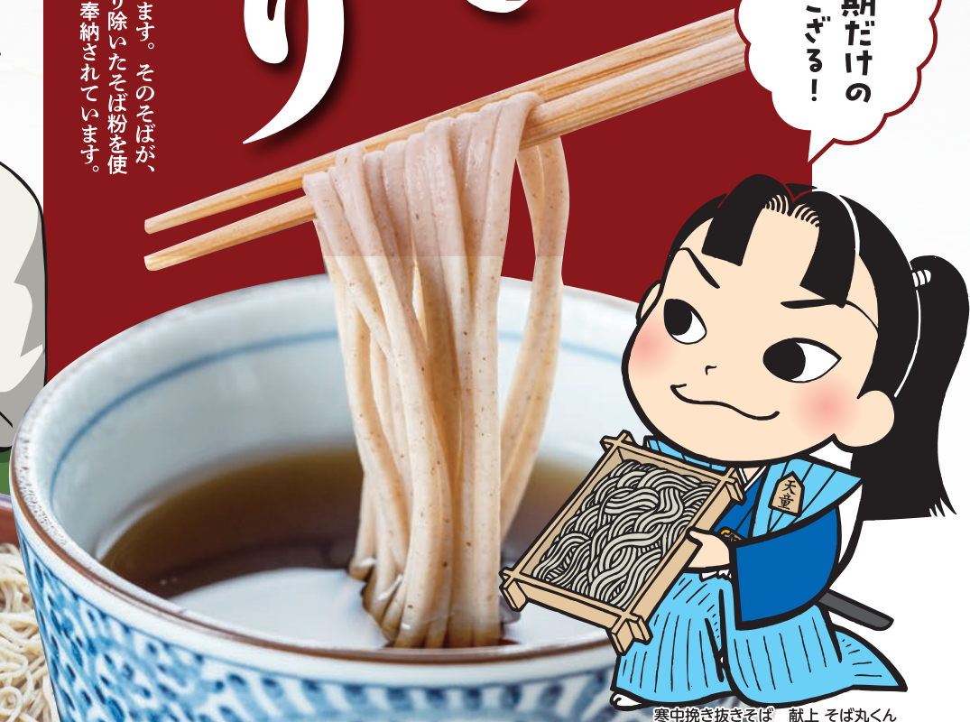
寒中挽きそば 献上 そば丸くん