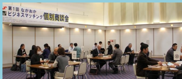
<商談イメージ(第1回の様子)>