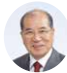
学長 山本 信治 (天童市長)