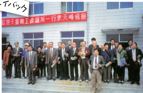
天童商工会議所設立5周年記念「中国経済ミッション」(平成9年10月10日～14日)