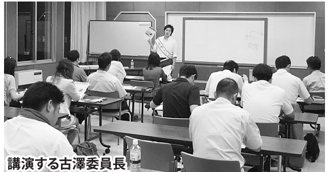
講演する古澤委員長

青年部では7月13日(金)に7月研修例会、8月8日(水)・9日(木)に夏まつり飲食ブース出店例会を行いました。