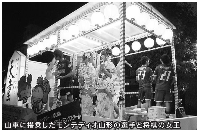
山車に搭乗したモンテディオ山形の選手と将棋の女王