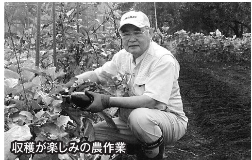
収穫が楽しみの農作業

仕事柄、全国を旅する機会があります。山形県は四季が明確であることから、体感や食感で季節を堪能できる素晴らしいところです。特に天童市は災害も少なく安全・安心なまちです。仕事を通し、自然災害の恐ろしさを目の当たりにしたからこそ気候や風土に恵まれていることを実感します。また、観光資源も豊富です。自信を持って“美しいふるさと天童”の良さをもっともっと全国的にアピールすべきです。