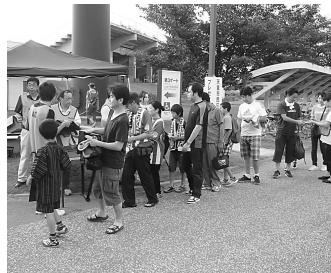
▲モンテエコバッグの配布