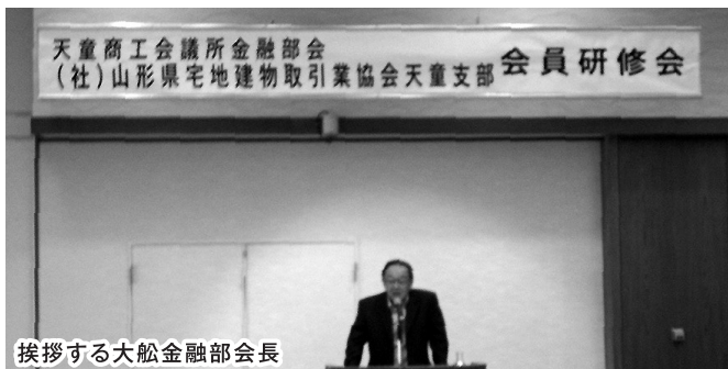
挨拶する大船金融部会長