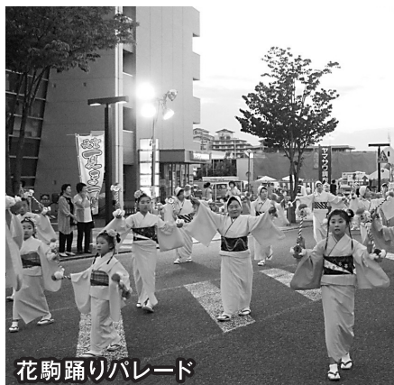
花駒踊りパレード