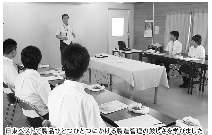
日東ベストで製品ひとつひとつにかかる製造管理の厳しさを学びました