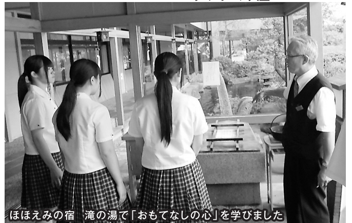
ほほえみの宿 滝の湯で「おもてなしの心」を学びました