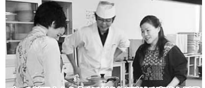
プロの料理人から「手ほどき」を受ける豪華な授業

“企業のための世界一受けたい授業”と題したセミナーを10月9日から5回シリーズで開催しました。