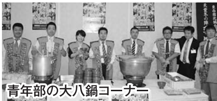
青年部の大八鍋コーナー