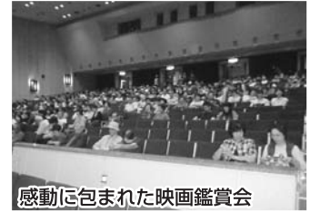
感動に包まれた映画鑑賞会

来場者は「忘れていた大切な気持ちを思い出させてくれる内容だった」と話していました。