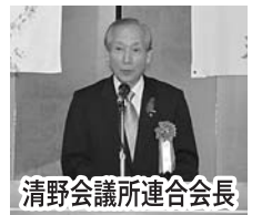
清野会議所連合会長