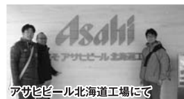
アサヒビール北海道工場にて

1日目は、中小企業庁の「がんばる商店街77選」に選ばれた「本郷商店街」を視察。歩道部分のロードヒーティング化を行うほか、至る所にベンチを配置し、ゆったりとショッピングが楽しめる憩いの商店街でした。 2日目はアサヒビール北海道工場へ。製造工程を見学し、モノづくりへのこだわりや環境への配慮などを目の当たりにしました。