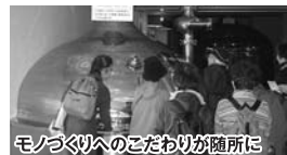
モノづくりへのこだわりが随所に