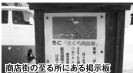
商店街の至る所にある掲示板