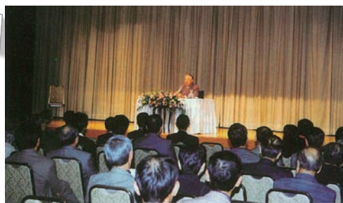
平成9年11月6日 設立5周年記念講演（プロ野球解説者：大沢啓二氏）