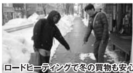
ロードヒーティングで冬の買物も安心