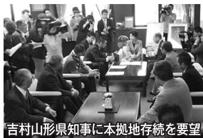
吉村山形県知事に本拠地存続を要望

3月25日(月)、山本天童市長は、山形県庁で吉村山形県知事にモンテの本拠地存続について要望しました。存続要望に同行した商工会議所・商業部会・青年部・