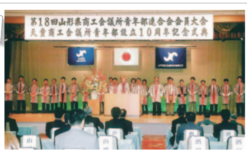
平成15年9月12日 青年部設立10周年記念式典